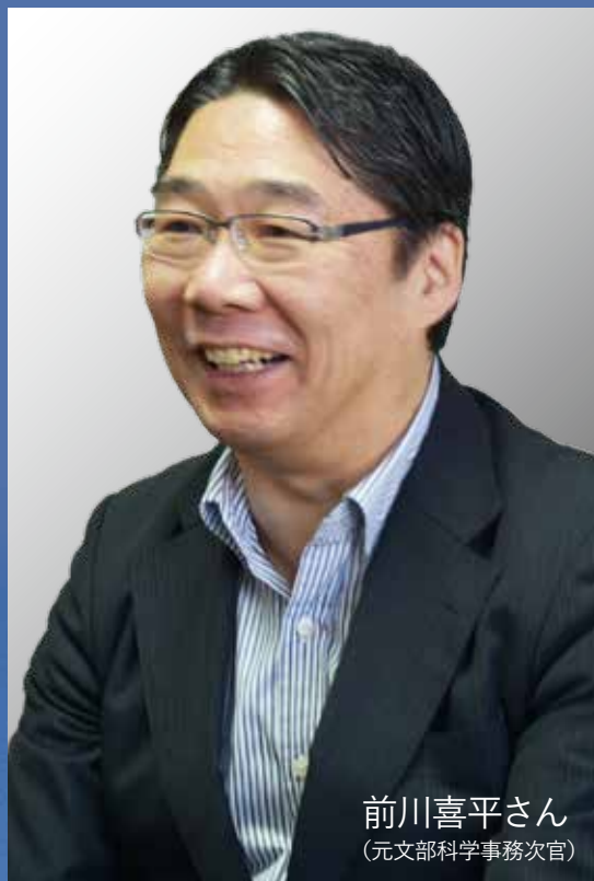
前川喜平さん (元文部科学事務次官)